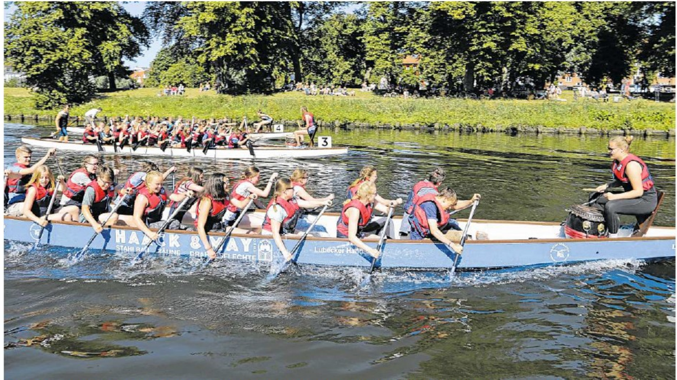
Auf der 200 Meter langen Strecke am Bootshaus der Lübecker Ruder-Gesellschaft kämpfen 19 Mannschaften um Pokale und Medaillen.

hardt-Gymnasiums am Start. „Ich habe nur einmal trainiert“, sagt sie lachend, „aber das ist auch nicht so wichtig. Hauptsache wir haben Spaß.“ Das meint auch Lehrer Flori-