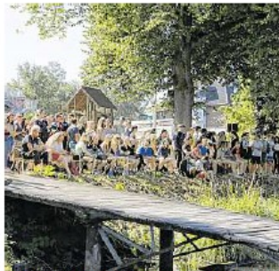
Dicht gedrängt verfolgen die Mannschaften und Zuschauer die Rennen. Dazu gibt es Party-Musik.

hardt-Gymnasiums am Start. „Ich habe nur einmal trainiert“, sagt sie lachend, „aber das ist auch nicht so wichtig. Hauptsache wir haben Spaß.“ Das meint auch Lehrer Flori-